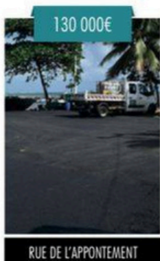
RUE DE L'APPOINTEMENT