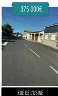
RUE DE L'USINE